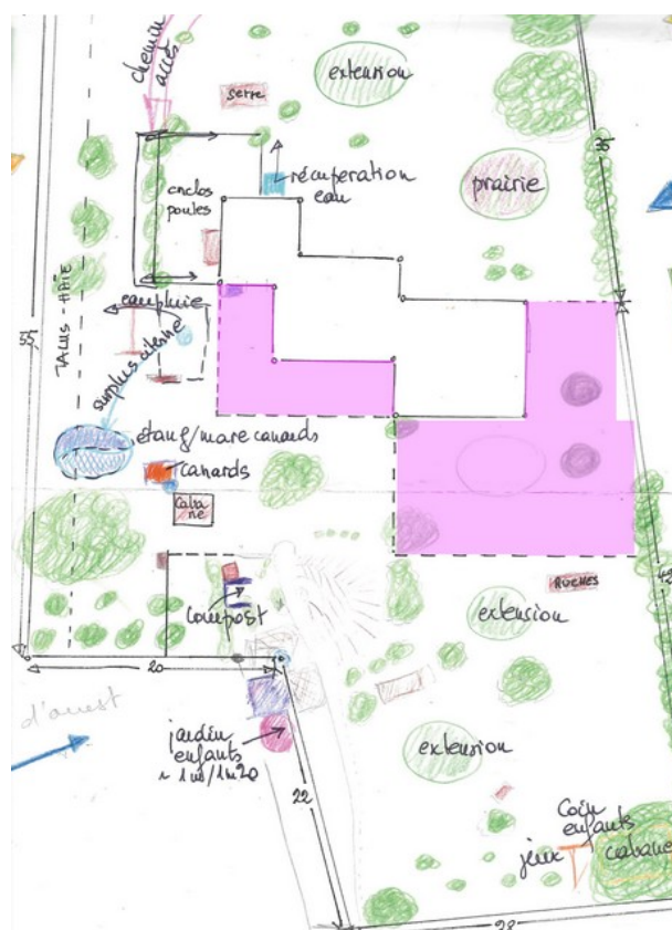
Figure 1: Plan du jardin et zones privées ( rose)